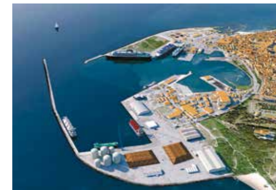
Visualisering af Masterplan 2050 for Rønne Havn, når alle faser af havneudvidelsen er realiseret.

At the same time, security of access will increase and plans can be made for a more appropriate division of port areas where ferry and tourism related activities are gathered in the northern part of the port while more industrial port activities are located in the southern part.