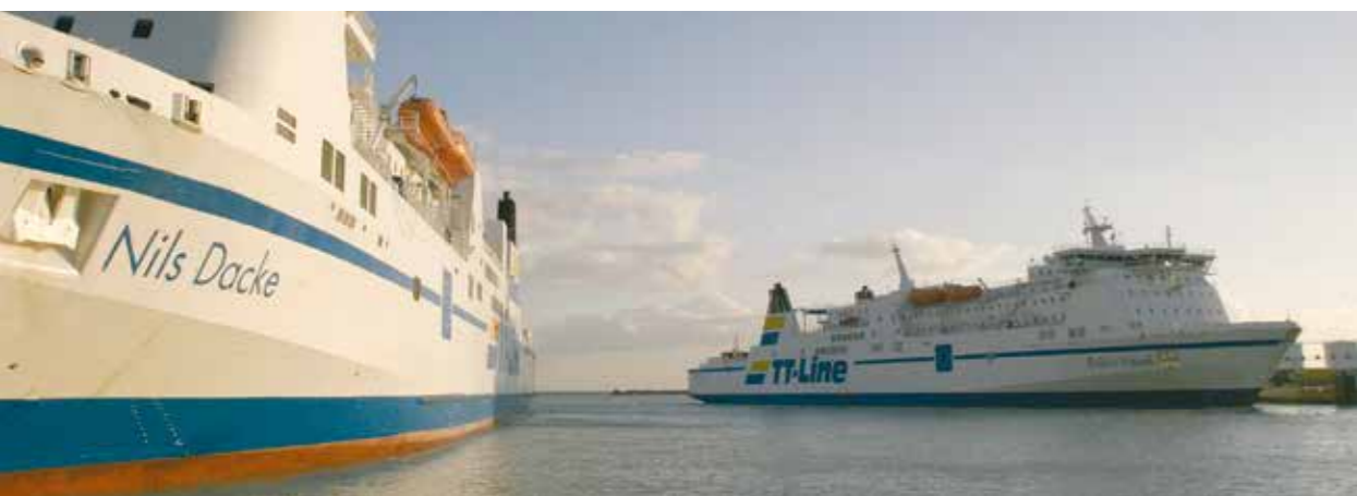
MF Nils Dacke kan tage 360 passagerer og har en kapacitet på 2200 lanemeter.

A strengthened infrastructure between Swinoujscie and Rønne is positive for tourism on Bornholm. The trip which takes just five hours will hopefully tempt many Polish and German holidaymakers to visit Bornholm. Swinoujscie is only 230 km from Berlin, and TT-Lines therefore expects that it will attract many guests from eastern Germany on board.